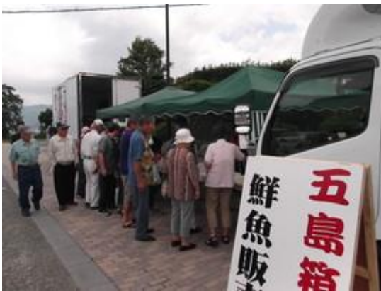
鮮魚コーナーは長蛇の列です！