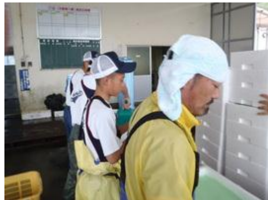
職員傍で指導を受けながら体験中