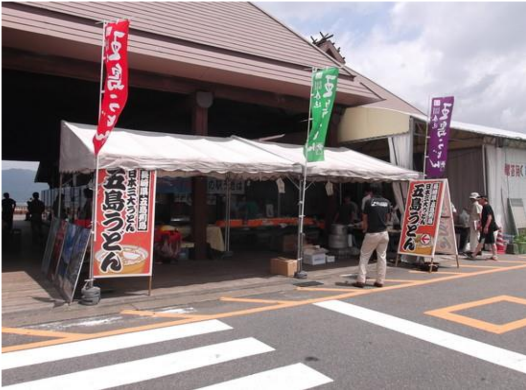
地元産品販売テント