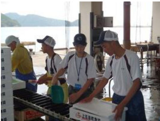
様になっています！！

ただ、体力が基本の漁協の仕事は生徒たちには少々大変だったのでは？と思いました。😓