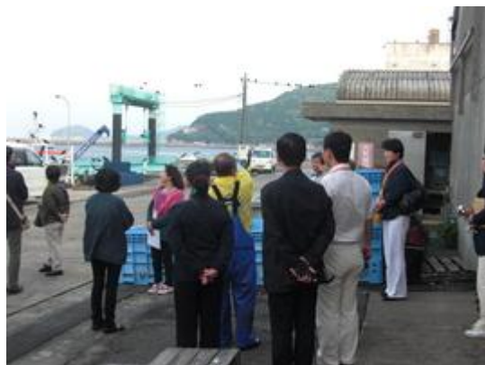
活魚センターにて活魚発送の説明