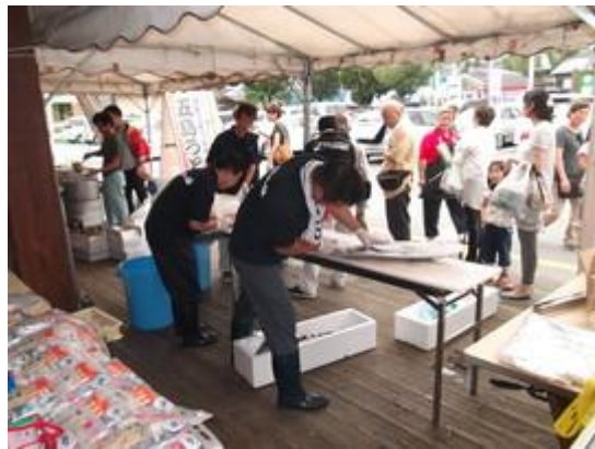
ヒラマサの解体ショー前は人だかり